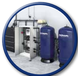
WATERTEC® WT 20