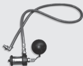
Zubringerpumpe Tano L 602026