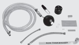
Anschlussset Tano L 602011