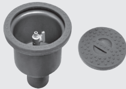
Entnahmestelle Fontana S