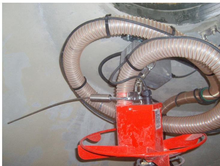
Maulwurf in Parkposition vor der Befüllung