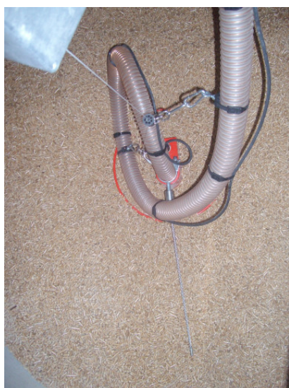
Maulwurf in Betriebsposition vor Befüllung

Nach dem Befüllvorgang den Wahlschalter (3) auf „Betrieb“ (C) umstellen. Dann beginnt der normale Betriebsvorgang mit dem Herablassen des Geräts auf die Pelletoberfläche und die grüne LED „Betrieb“ (4) blinkt.