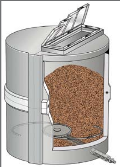
Hackschnitzelbehälter mit Befüllöffnung, Austragsystem mit Spannfeder und Förderschnecke am Speicherboden.