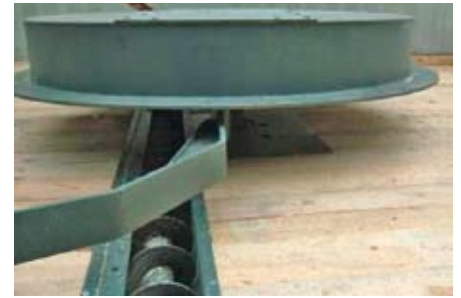
Das Austragsystem mit Spannfeder und Förderschnecke am Speicherboden ist sowohl für Hackschnitzel als auch für Pellets geeignet.

Transportkosten-Anteil und bei Wärmeverbund-Anlagen in der Größe ab 200 kW.“ SWL setzt jährlich 70 000 m 3 um und hat für mehrere Jahre im voraus Festpreise für den Einkauf der Hackschnitzel vereinbart. Der Verkauf der Wärme geschieht langfris-