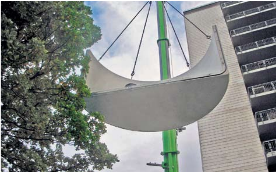
Betonfertigteile des Hackschnitzelbehälters am Kran. Der Lagerbehälter für das Studentenwohnheim wurde von der Mall GmbH anschlussfertig geliefert.

nung verdunstende Wasser bindet Wärme, die der Wasserdampf dem Kessel „raubt“. Die Feuchte kann darüber hinaus auch dem Schornstein schaden oder zu Fäulnisprozessen im Lagerbehälter führen.